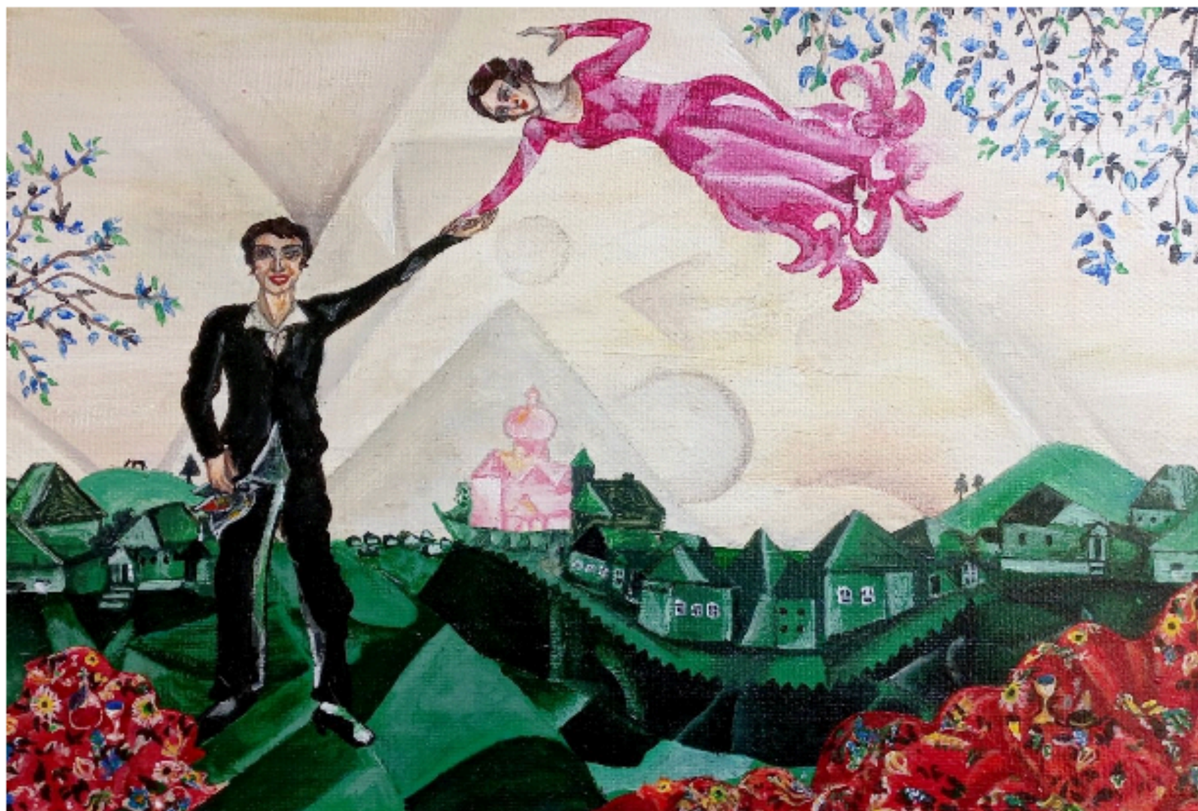
Marc Chagall La passeggiata , 1917

Mercoledì 6 maggio - Aula 9 Palazzina Donne Campus del Pionta, Viale L. Cittadini 33, Arezzo